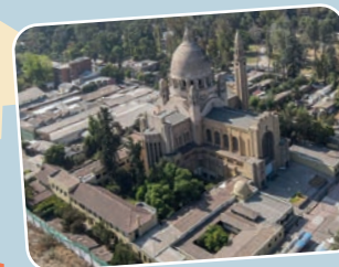
Basílica de Lourdes Santo Domingo 3747, Quinta Normal.