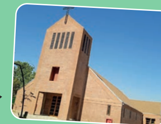
Capilla Madre Admirable Parroquia Pietro Bonilli Av. Jorge Ross Ossa 1191, Puente Alto.

¡Conviértete en un peregrino de esperanza y deja tu huella!