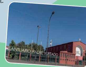
Santuario de San Alberto Hurtado Av. Alberto Hurtado 1090, Estación Central.