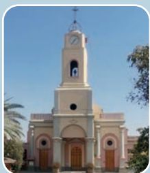
2. ZONA SUR Parroquia Santuario Inmaculada Concepción Av. Sta. Rosa 9091, San Ramón.