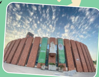
5. ZONA CORDILLERA Parroquia Nuestra Señora del Rosario Av. Presidente Riesco 6430, Las Condes.