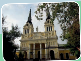
Santuario a María Santísima Fundación Las Rosas Rivera 2005, Independencia.