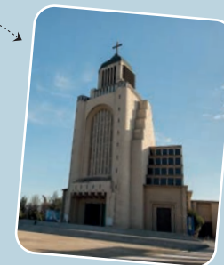
6. ZONA OESTE Santuario Nacional de Nuestra Señora del Carmen El Carmen 1750, Maipú.