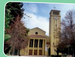
7. ZONA DEL MAIPO Parroquia Nuestra Señora de las Mercedes Santo Domingo 444, Puente Alto.