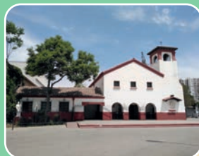
4. ZONA ORIENTE Parroquia San Vicente de Paul Av. Walker Martínez 1, La Florida.