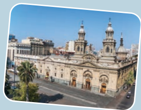
1. ZONA CENTRO Iglesia Catedral Metropolitana Plaza de Armas, Santiago.