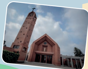
3. ZONA NORTE Parroquia Inmaculada Concepción Caletera Oriente Gral. San Martín 0201, Colina.